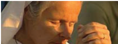
Sor Emmanuel + (Traducido del francés)

Querida Gospa, ¡inspíranos TÚ misma lo que deseas recibir de parte nuestra como regalo de Aniversario! Estamos tan felices con tus visitas ¡GRACIAS!