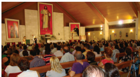
Parroquia de Santo Tomás de Aquino MURCIA

Asociación “HIJOS DE MEDJUGORJE” España.