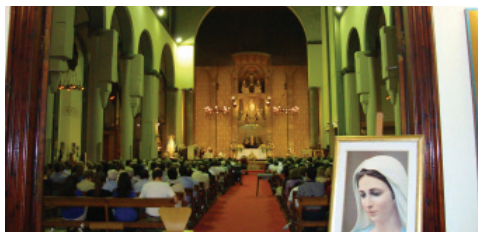
Parroquia de Santa María de Gracia BARCELONA