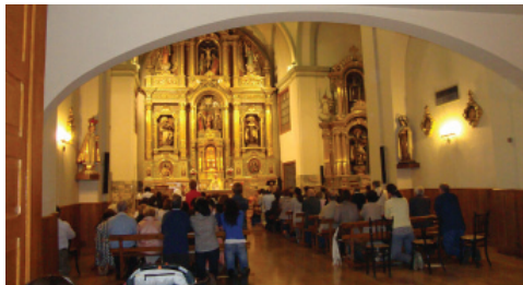
Convento de las Carmelitas Descalzas PAMPLONA