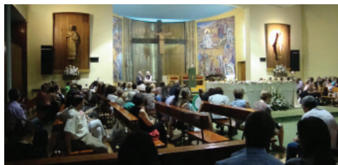
Parroquia de San Braulio ZARAGOZA