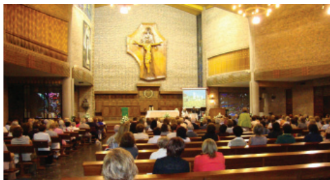
Parroquia del Santísimo Redentor BILBAO