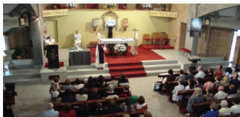
Parroquia de Nuestra Señora de la Paz VIGO